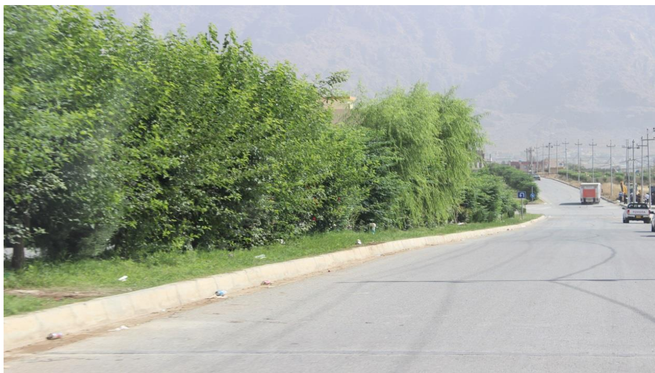
یه کیك له ناوهنده شوسته سهوزکراوهکاني شاری رانیه