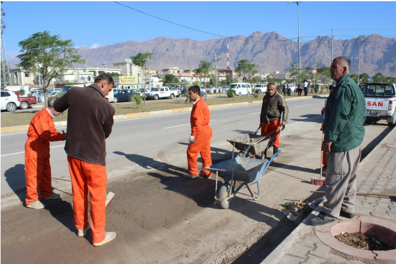
ژینگه پاریزانی شارهوانی رانیه (پاكردنه وهی شه قامی سه ره کی)