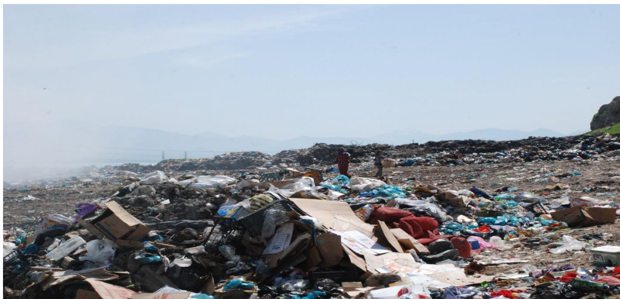
زېل و خاشاکی مالان