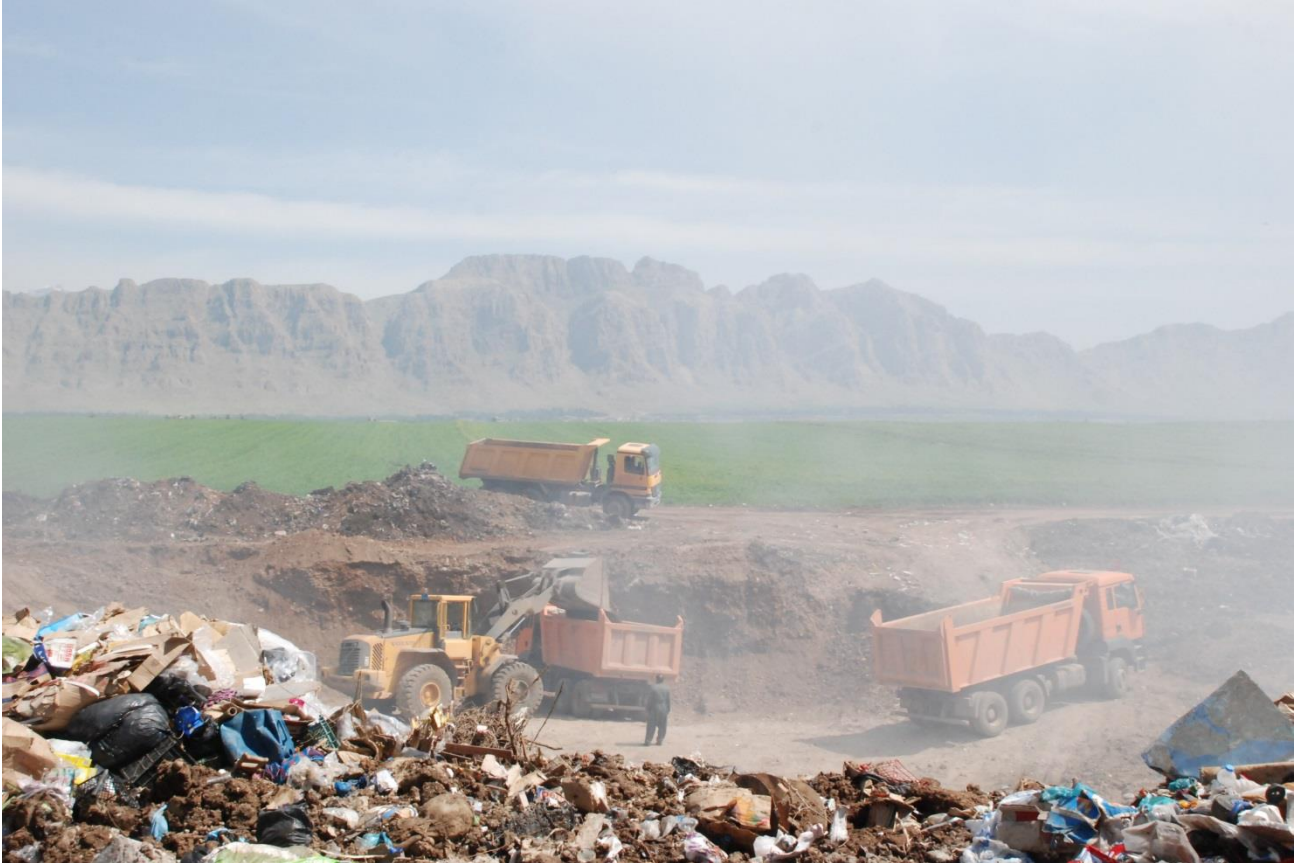
سوتان و دووكەلى پاشماۋەۋ خۇل و خاشاك لە رانىە

۴. ھەۋلدان بۇ كۆكردنەۋەى پاشەپۇكانى مرقۇ و ژىر گل كىردنى يان چارەسەر كىردنى لە رىگەى كارگەى تايبەتى پووكار و دووبارە بەكارھىننەۋەى ئەۋ مادانە ۋەك پەين و شتى بەكەلكى تر.