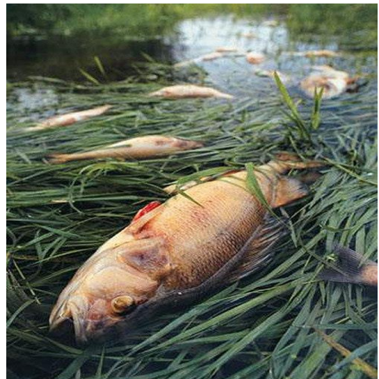
چەہند دیمەنیکی جیای پیسبوونی ژینگہ