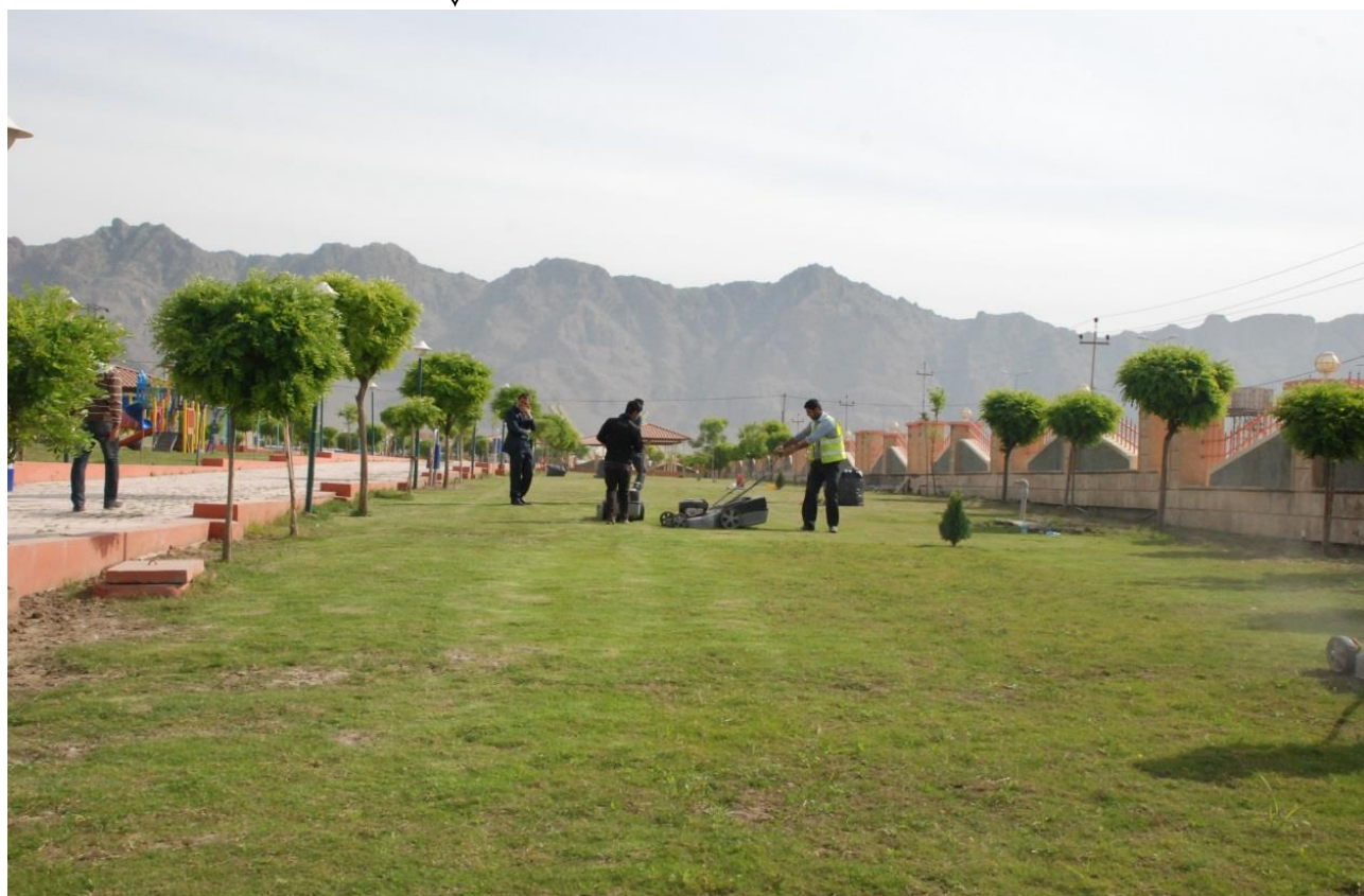
پارکی (دهروازه) له رانیه