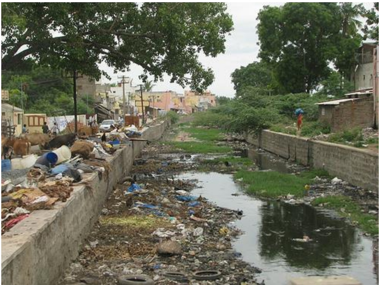
دیمه نیکی بهر بلاوی پیس بوونی ژینگه

۱۱. گرنگی دان به شوینه گهشتیاری یهکان بهتایبهتی بناری (کیوهپرش) که له ئیستادا بووته شوینیکی گهشتیاری گرنگی پوژانهی هاوولاتیان ئهویش به دابینکردنی سهراوهی ئاوو (W.C) و شوینی حهوانهوهو کافتیرییاو شوینی یاری منالان. جگه لهو شوینهش چهند سهیرانگایهکی ترهیه که هیچ خزمهتگوزاریان نی یه و دهکریت کاری گهورهی بوئه نجام بدریت وهک (سهیرانگاکانی دوئی سهرکهپکان و کانی قولکهو سهرسیان و بناری چپای (حاجیله)).